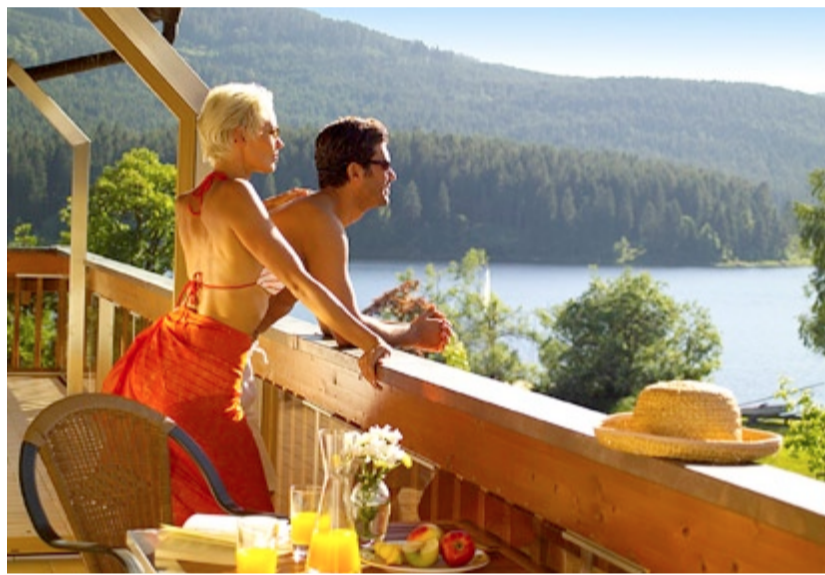
Vue panoramique de la Suite Emotion

Commencer les vacances, la période la plus précieuse de l'année, dans une chaleur caniculaire et dans d'interminables embouteillages en route vers le sud ? Pourquoi ?! Gardez votre sang-froid, ne vous lancez pas dans de telles actions cet été et choisissez une destination de vacances accessible en peu de temps à une altitude (plus fraîche) de 1.000 mètres. Comme par exemple le lac Schluchsee au sud de la Forêt-Noire qui vous offre toute une panoplie d'activités sportives autant sur l'eau que sur terre. Et profitez en plus des services bien-être (indépendamment des conditions météorologiques) de l'hôtel wellness 4 étoiles Auerhahn qui donne un sens à ce mot à la mode comme aucun autre établissement. Ici, la cuisine n'est pas seulement saine et succulente mais l'épicéa et la fleur de sureau locaux déploient également leurs effets bienfaisants dans le cadre des applications bien-être. Et la boisson de bienvenue est consommée lors d'un tour en bateau. La «fraîcheur d'été» à l'hôtel Auerhahn est idéale pour les individualistes qui dé-