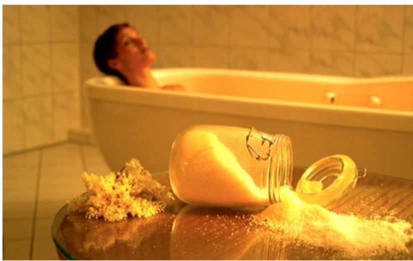
Bain de fleurs de sureau

▷ Pour de plus amples informations: Wellnesshotel Auerhahn, Vorderaha 4, D-79859 Schluchsee, tél.: 00 49 (0) 7656 / 9745-0, fax: 00 49 (0) 7656 / 9270, courriel: info@auerhahn.net, Internet: www.auerhahn.net